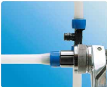
۲ حلقه و لوله را گشاد نموده