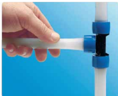
۳ اتصال را داخل لوله قرار دهید

شرکت پارسیان پکس (سوپرپکس) در سال ۱۳۸۶ و با هدف ترویج استفاده از لوله و اتصالات پلیمری مهندسی شده تاسیس گردید.