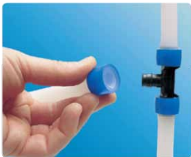
۱ حلقه را سر لوله قرار داده